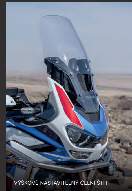
VÝŠKOVĚ NASTAVITELNÝ ČELNÍ ŠTÍT

Palivová nádrž o objemu 24,8 litru prodlužuje vzdálenost mezi zastávkami a pohodlné sedlo (standardní výška 850-870 mm, možnost nižšího sedla) znamená, že také vy můžete urazit stejnou porci kilometrů. A motocykl je stvořen k přežití, díky velkému hliníkovému krytu, který chrání celý spodek motoru a hliníkovým bočním panelům, sloužícím jako ochrana v krizových situacích. Hliníkový zadní nosič je součástí standardní výbavy. Vyhřívané rukojeti zaženou chlad při časných ranních odjezdech, zatímco tempomat zpříjemní pobyt na nekonečných dálnicích. Je tu také zásuvka na dobíjení osobní elektroniky, a bezdušové pneumatiky, které usnadní opravy na cestách.